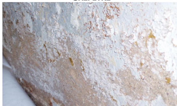
PLATRES, PIERRES, CEMENTS